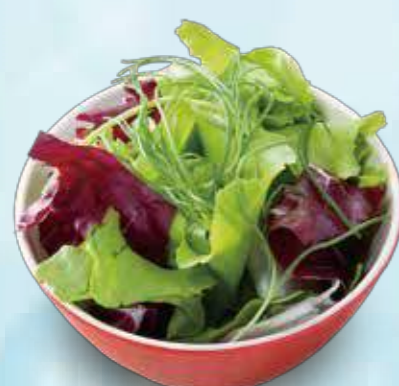
53 Mini salad ミニサラダ ¥250