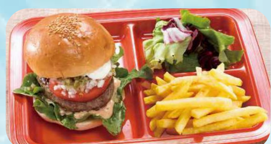
Domestic beef hamburger plate 24 国産牛ハンバーガープレート ¥1,250