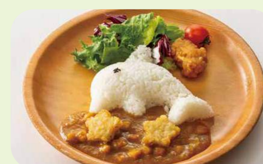
Dolphin curry plate 32 ドルフィンカレープレート ¥700