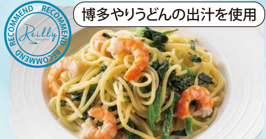
Japanese cream with shrimp and spinach 15 海老とほうれん草の和風クリーム ¥980