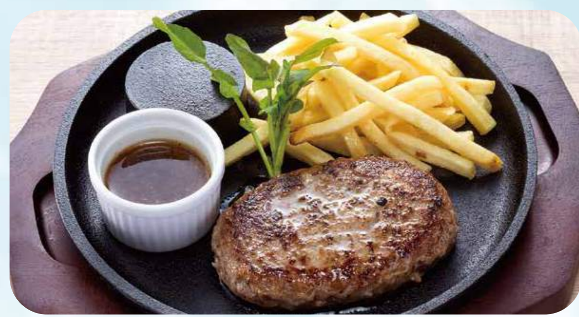
Iron plate hamburg 01 国産牛鉄板ハンバーグ ¥1,250 ライス付き