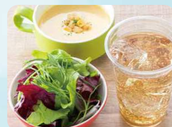
50 Salad soup drink set サラダスープドリンクセット ¥800