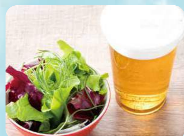
51 Beer set ビールセット ¥800