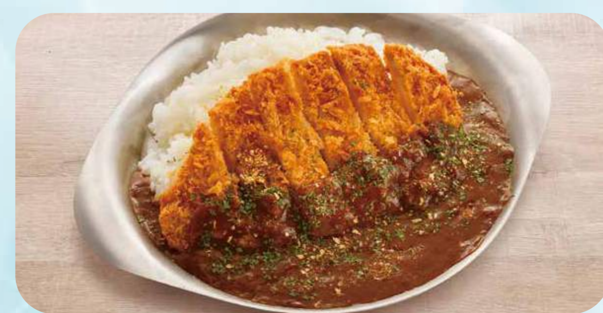
Pork cutlet curry 22 豚ロースカツカレー ¥1,000