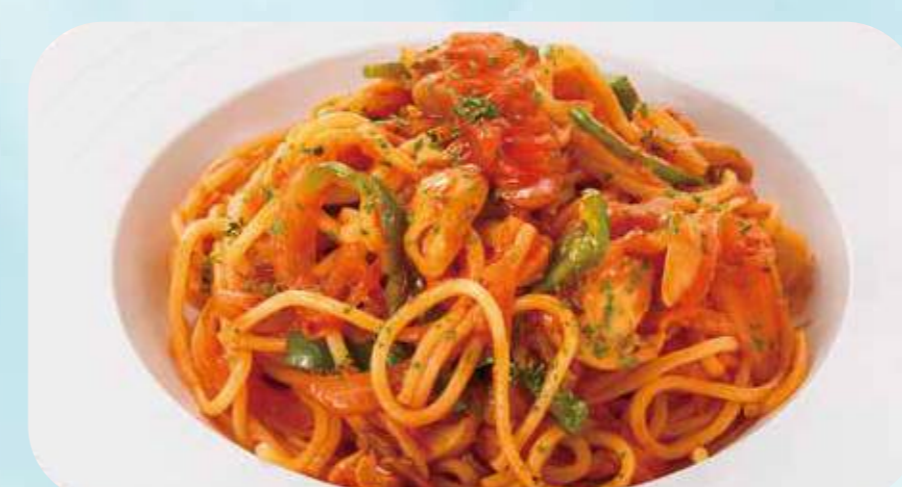
Sausage napolitan 17 ソーセージナポリタン ¥890