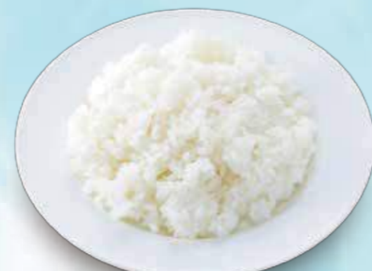
55 Rice ライス ¥200 大盛りはプラス¥100