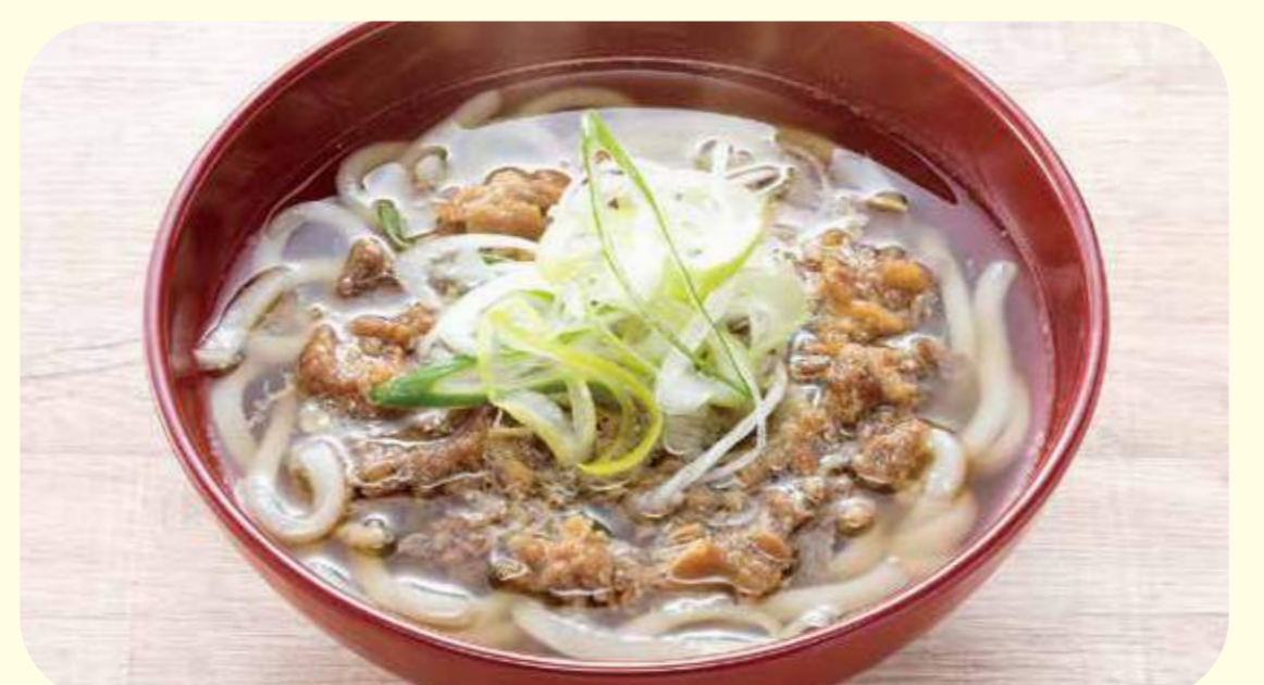
Meat noodles 12 肉うどん ¥800