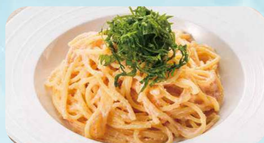
Mentaiko's cream 16 明太子クリーム ¥890