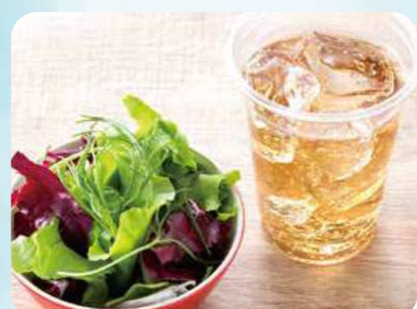
48 Salad drink set サラダドリンクセット ¥500