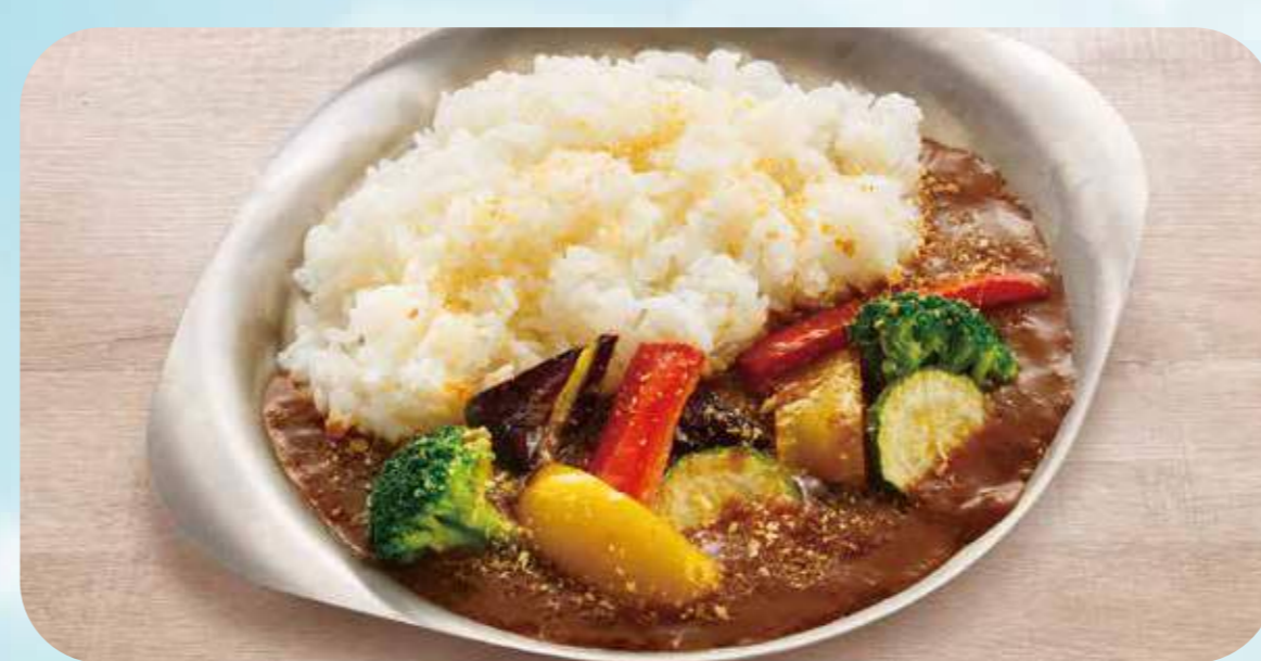
Vegetable Curry 21 ベジタブルカレー ¥900