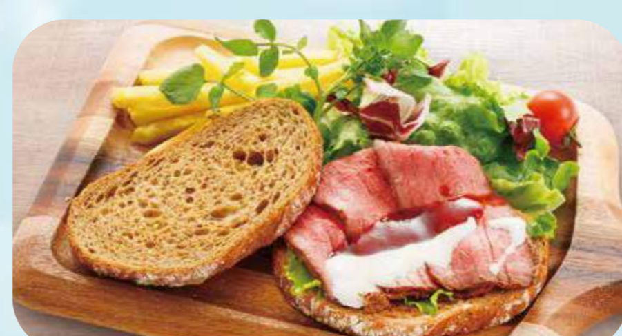
Roast beef sandwich with 15 grain bread 23 十五穀ブレッドのローストビーフサンド ¥1,100