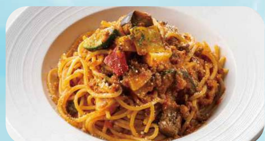
Vegetables&bolonese 14 ゴロゴロ野菜のボロネーズ ¥980