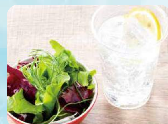
52 Lemon sour set レモンソーダセット ¥680