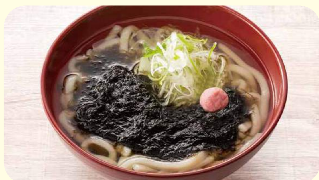
Seaweed noodles 11 のりうどん ¥780

福岡のうどん専門店 博多 やりうどん 監修 福岡県産小麦を使用したうどん麵 × ダシは長崎県産のアゴ、鹿児島県産のカツオ、 熊本県産のウルメイワシ、サバと 九州産のお魚を使用