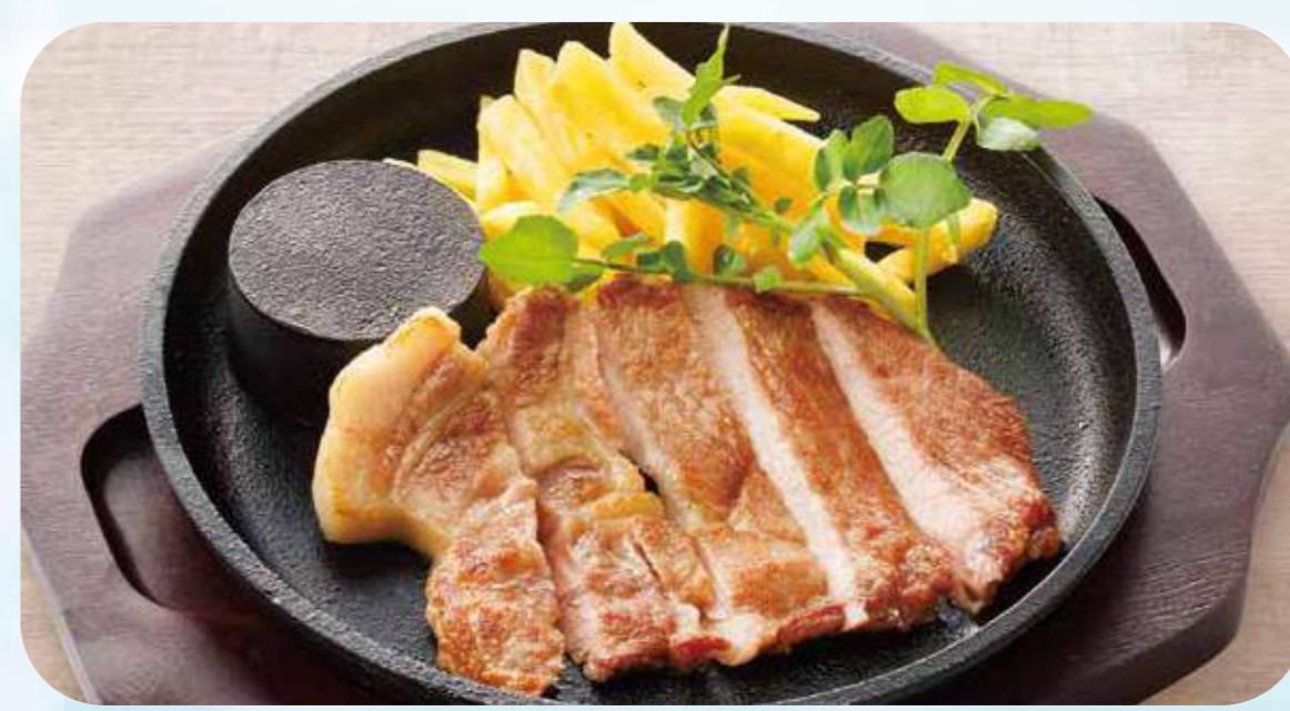
Salt koji ITOSHIMA pork grill plate 03 糸島豚の塩麹ローストポーク鉄板 ¥1,200 ライス付き