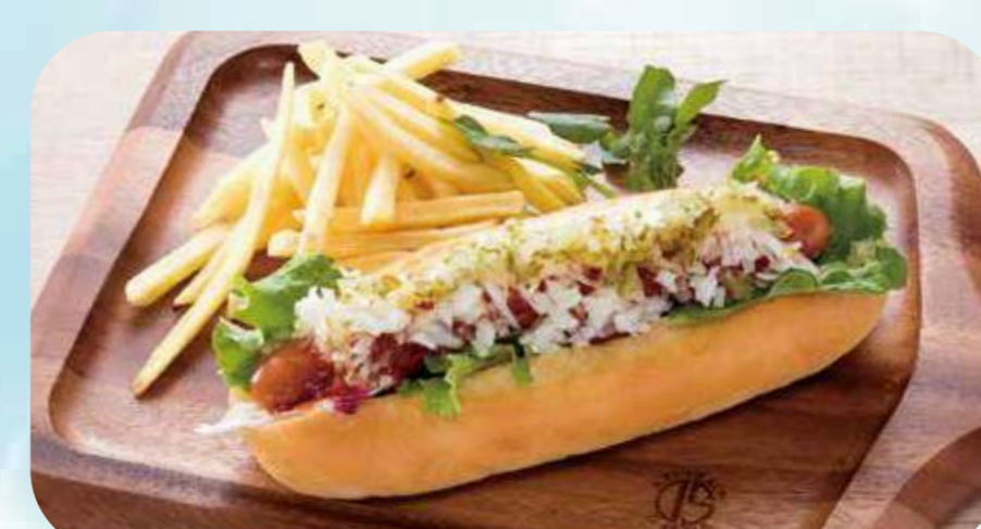
Hot dog plate 26 こだわりブレッドのホットドッグプレート ¥780