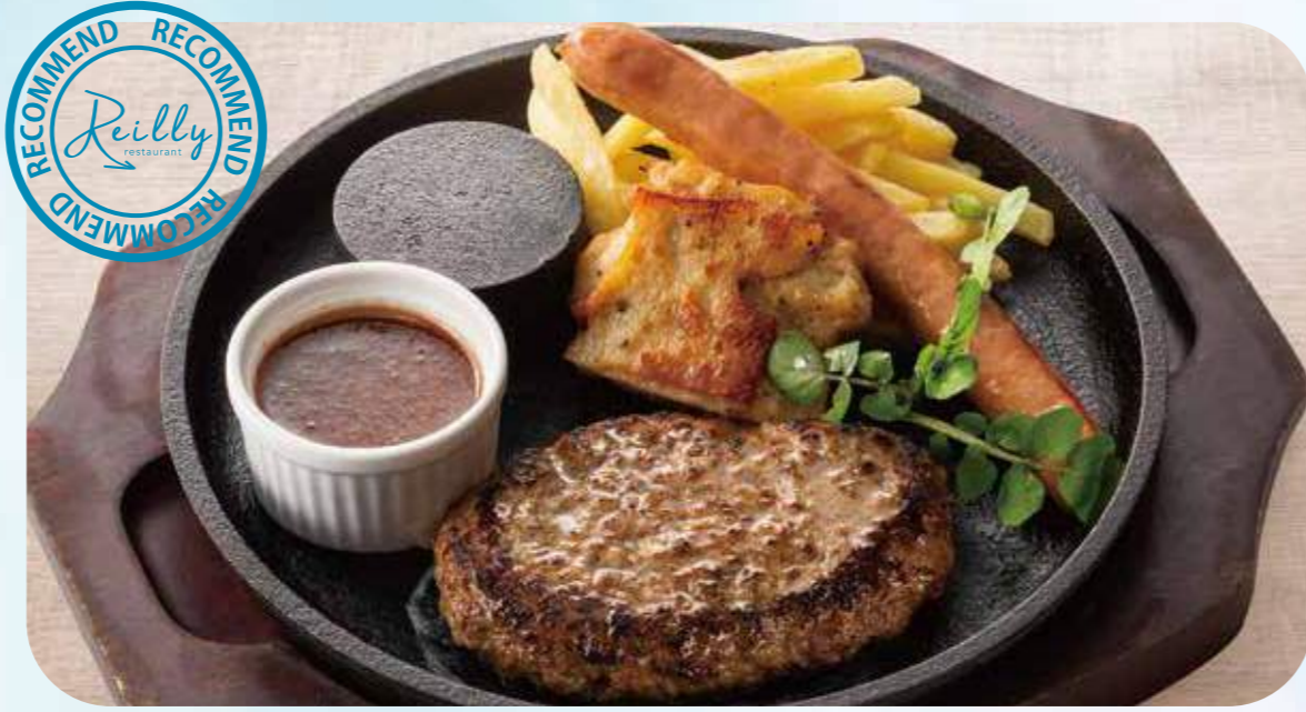
Iron plate hamburg&grill 02 国産牛鉄板ハンバーグ・グリルセット ¥1,590 ライス付き