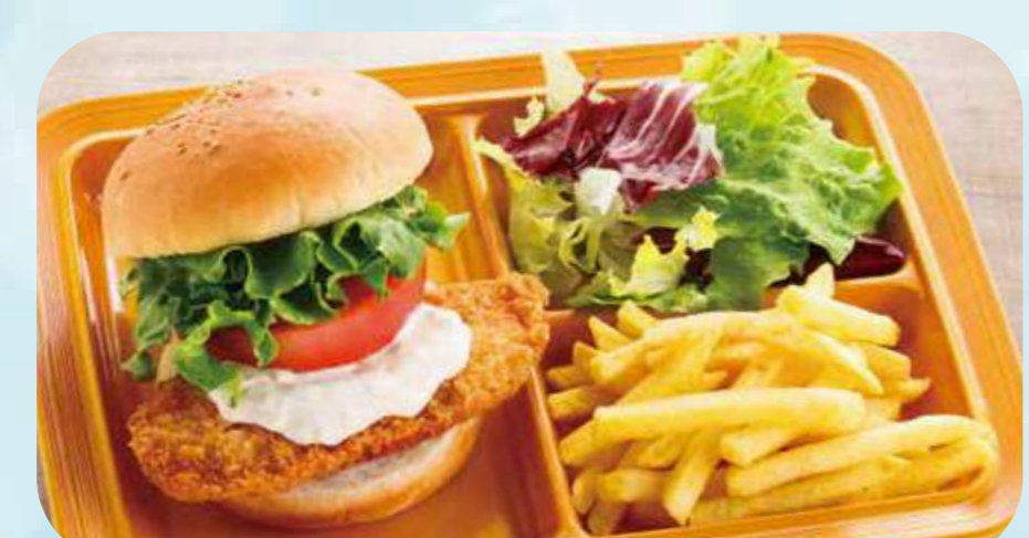
Shark fish burger plate 25 シャークフィッシュバーガープレート ¥860