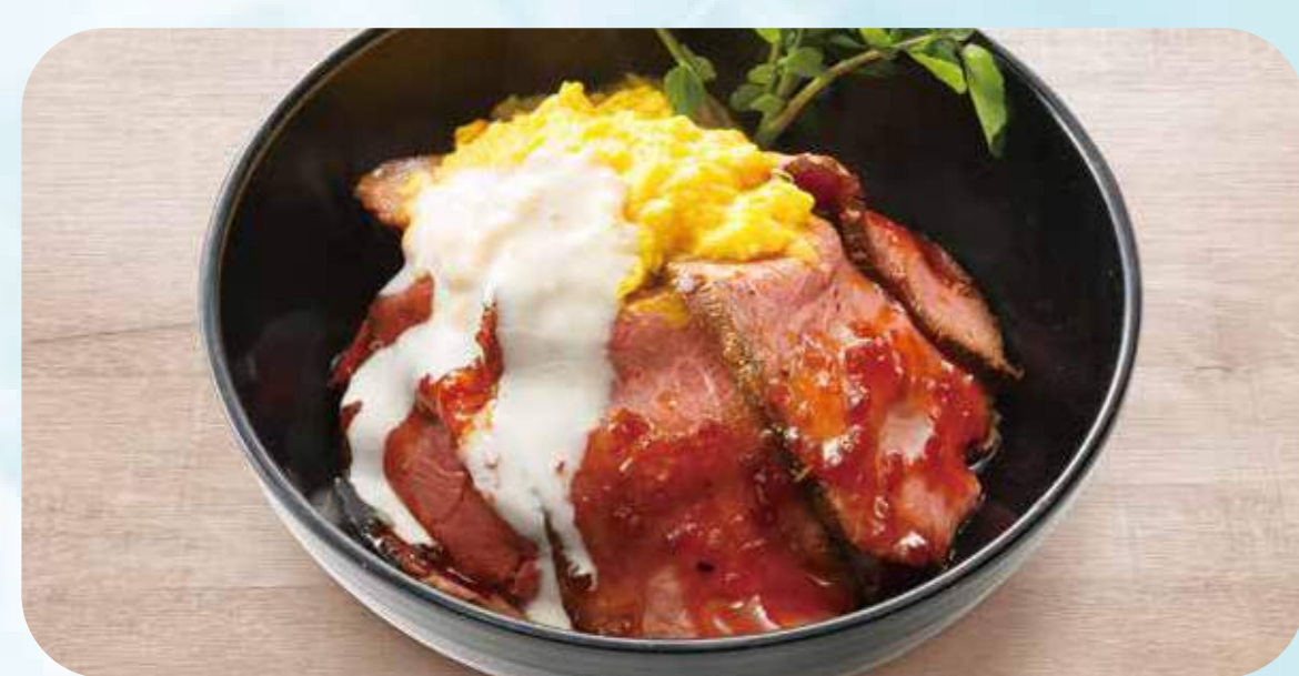
Roast beef bowl 04 ローストビーフ丼 ¥1,180