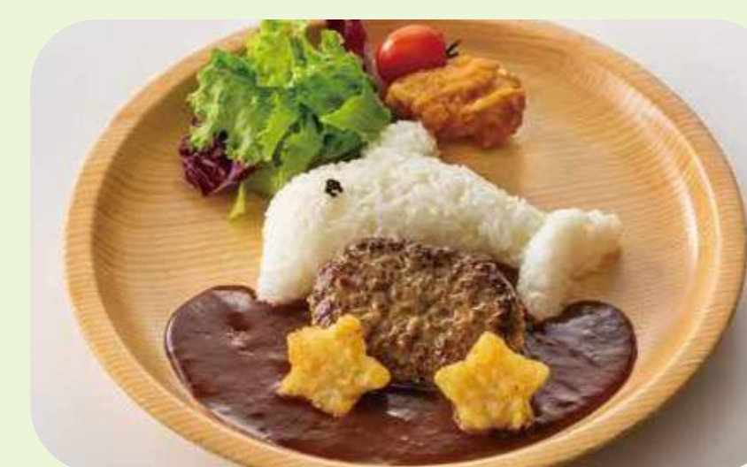
Dolphin hamburger plate 31 ドルフィンハンバーグプレート ¥750