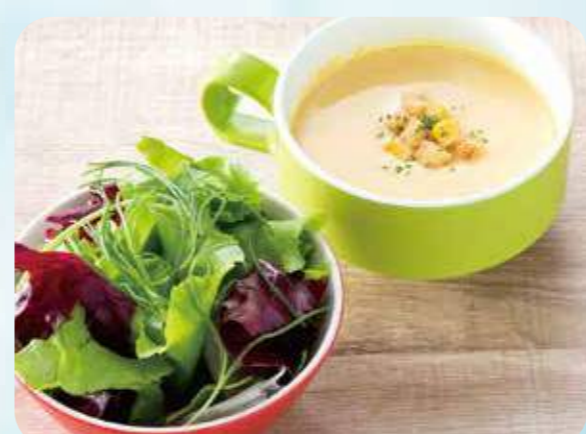
49 Salad soup set サラダスープセット ¥500