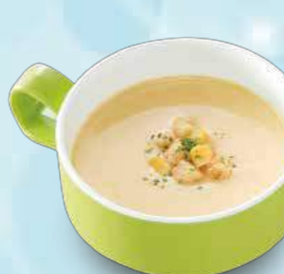
54 Corn soup コーンスープ ¥300