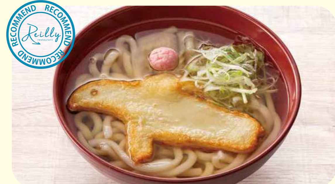
tempura noodles 13 ペンギン天うどん ¥700