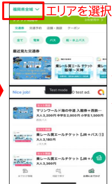
⑥「購入を確定」をタップ